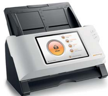
eScan A150

■ Im Praxisalltag ist es hilfreich, Dokumente für Ärzte, Kliniken, Labore und Krankenkassen oder den jeweiligen Befund für Patienten schnell und unkompliziert zu scannen und an den entsprechenden Adressaten zu versenden. Der Standalone-Netzwerkscanner „eScan A150“ von Plustek ist kompakt, mobil und ermöglicht das Scannen, Versenden und Speichern von Dokumenten in wenigen Schritten ( www.plustek.de ). Ein Anschluss an einen externen Computer ist nicht notwendig. Das Gerät ist mit einem Android-Betriebssystem ausgestattet und zeichnet sich daher durch einen